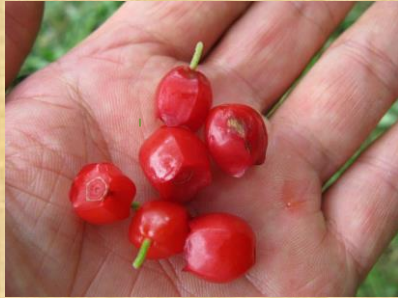
完熟ウスノキの実