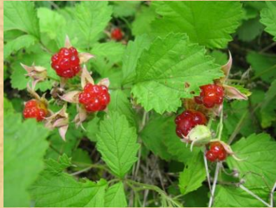
完熟ナワシロイチゴ