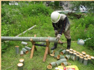
タケかつぼ台作り