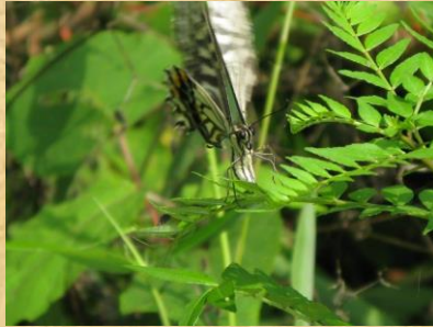
アゲハの産卵サンショウ