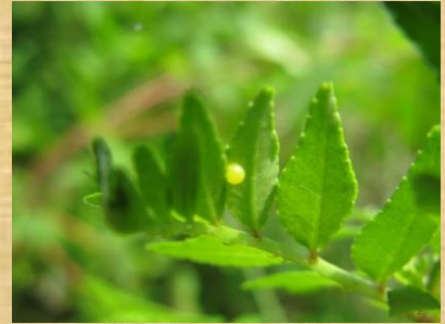
アゲハの卵とサンショウ