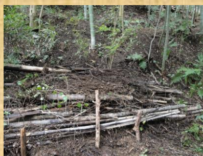
本伏場所横の道の補修