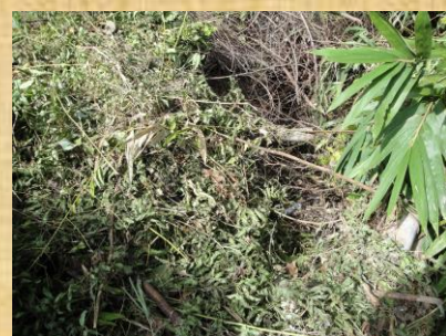
駐車場の寝床（盗掘？）