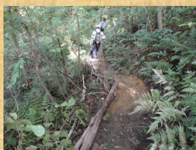
桜広場への道補修完了