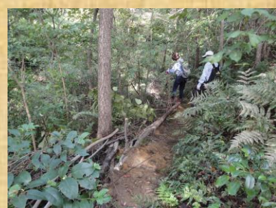
桜広場への道補修