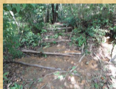
桜広場横の道に階段設置