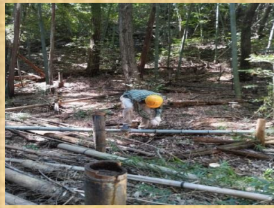
明るくなった林床②