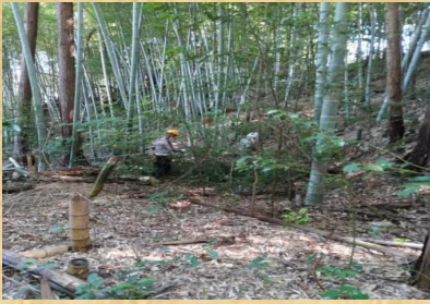
明るくなった林床①