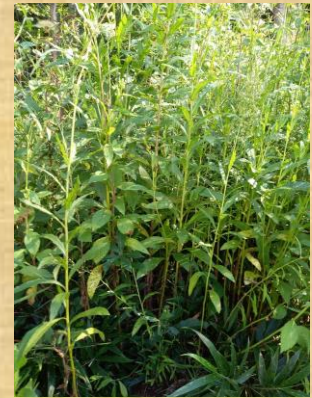
草に埋もれている