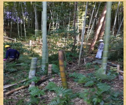
まだまだ伐採が必要