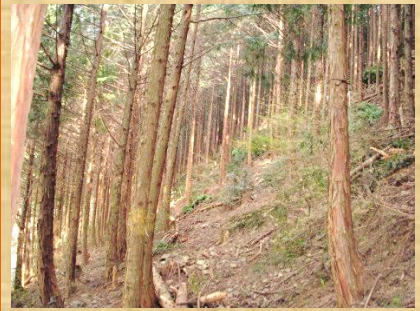
間伐で良くなった樹木