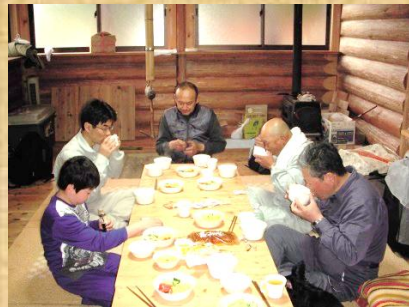
昨日は少し飲みすぎたかな 朝食