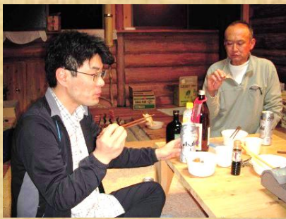
楽しい仲間と美味しい料理