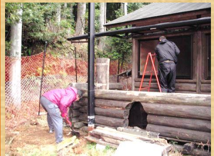
ログにカーポートを建てて 雨除け