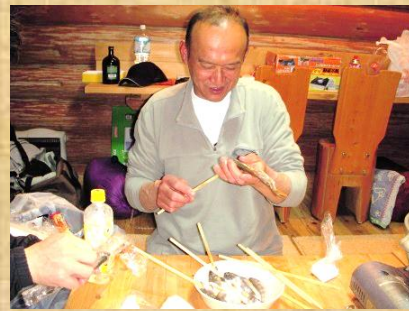
ログハウスで アマゴの下ごしらえ