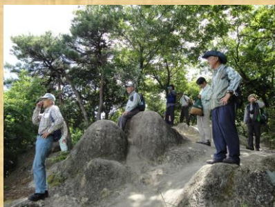
傍示の里へ向かう途中の展望台