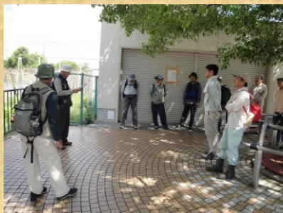
河内磐船駅で説明