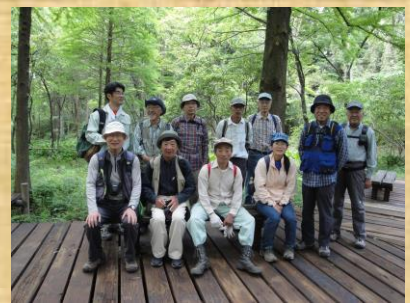
ミズバショウの湿地