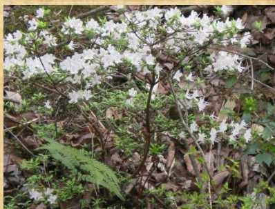
シロバナウンゼンツツジ