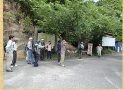
くろんど池に到着