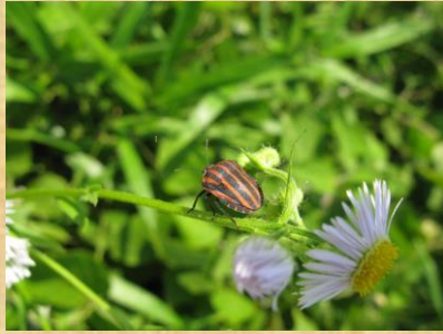
アカスジカメムシ