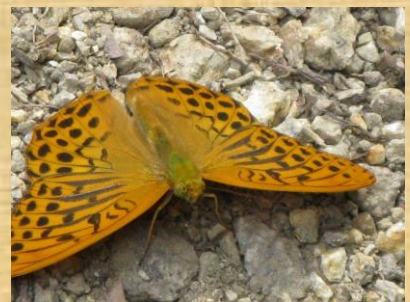
ミドリヒョウモン