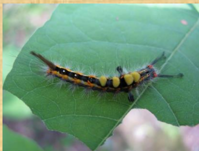
ヒメシロモンドクガ