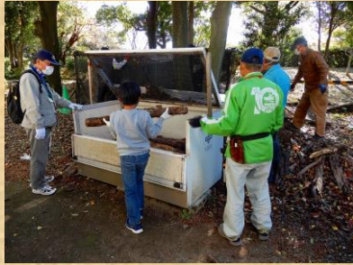
1. 飼育箱へ古ホダギの投入