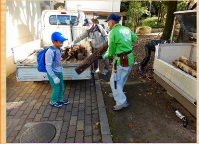
3. 古ホダギ軽トラへ