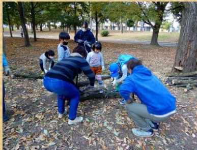
8. 小枝の整理 (5)