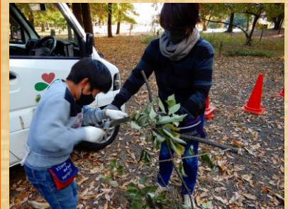
6. 小枝の整理 (3)