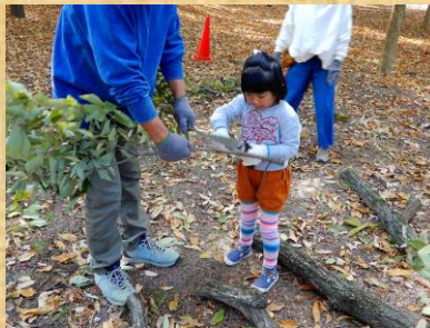
5. 小枝の整理 (2)