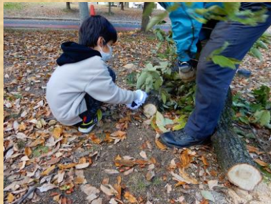
7. 小枝の整理 (4)