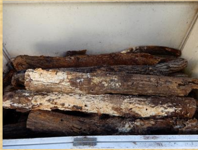
2. 飼育箱古ホダギ満杯