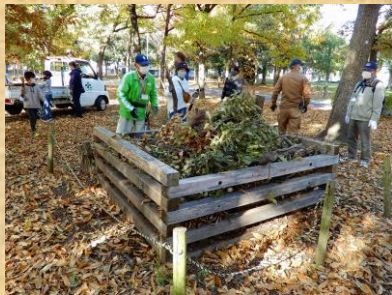
4. 昆虫の寝床へ古ホダギ投入