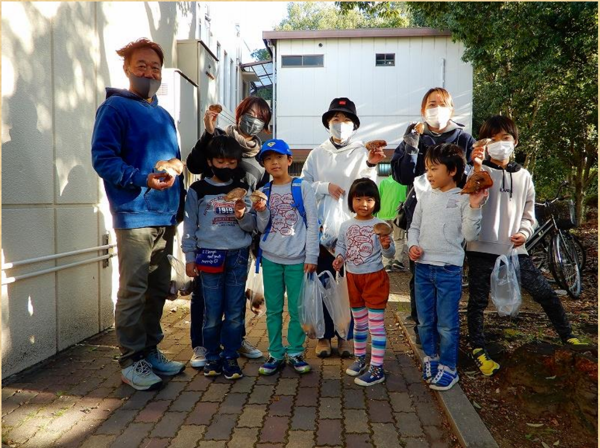
14.シイタケにほっこり