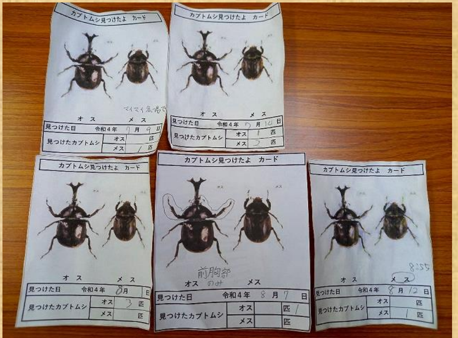
カブトムシボイス