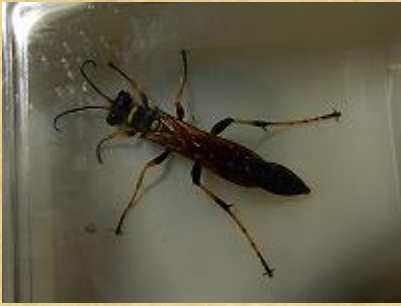
アメリカジガバチ