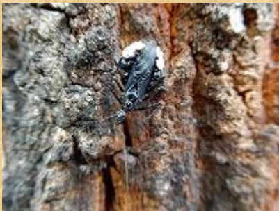
ヨコズナサシガメ