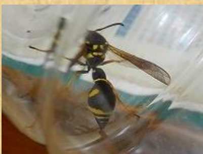
キボシトックリバチ