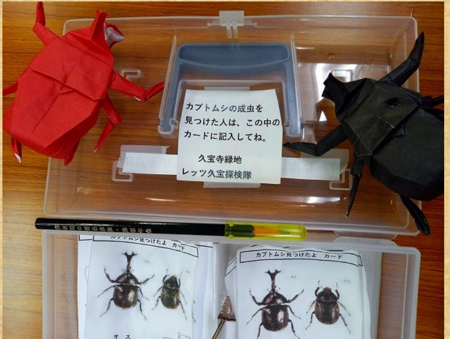
カブトムシボックス