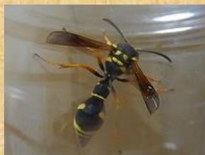
キボシトックリバチ