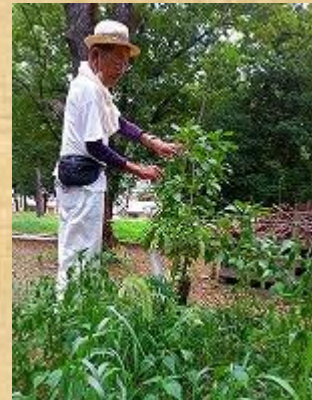
バックヤードの手入れ