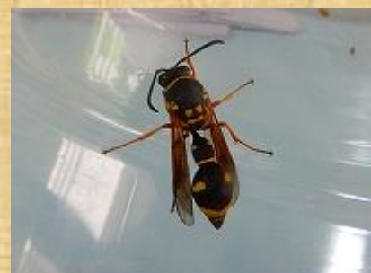
キボシトックリバチ